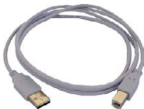
Cable de transmi- sión, terminado con conector USB