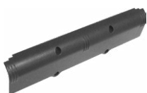
Batería recargable 4,8 V 4,2 Ah