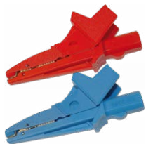
Cocodrilo 1 kV 20 A rojo / azul